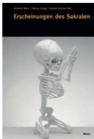
Band 3 Erscheinungen des Sakralen 220 Seiten mit 8 Farbtafeln und 50 s/w-Abbildungen. 2011 Gebunden €29,90 (D) 978-3-496-02823-9