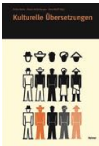
Band 4 Kulturelle Übersetzungen 257 Seiten mit 8 Farb- und 33 s/w-Abbildungen. 2012 Gebunden €29,90 (D) 978-3-496-02833-8