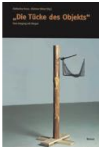
Band 2 »Die Tücke des Objekts« 253 Seiten mit 16 farbigen und 60 s/w-Abbildungen. 2009 Gebunden €29,90 (D) 978-3-496-02807-9