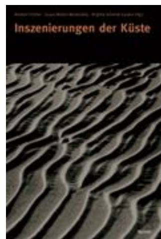
Band 1 Inszenierungen der Küste 288 Seiten mit 8 farbigen, 83 s/w-Abbildungen und 12 Strichzeichnungen. 2007 Gebunden €29,90 (D) 978-3-496-02800-0