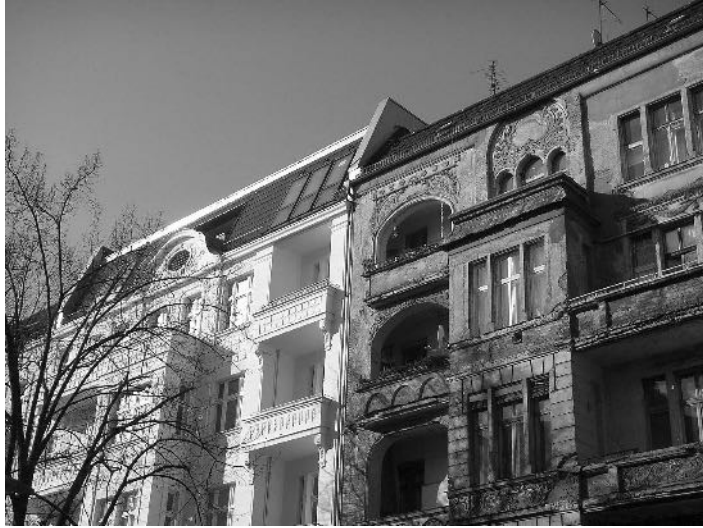
Abb. 5 Simon-Dach- Straße in Berlin- Friedrichshain

der Unbestimmtheit im Stadtraum am Beispiel der Großwohnsiedlungen des Berliner Stadtbezirks Marzahn-Hellersdorf. Entlang prägnanter architektonischer als auch gesellschaftlicher und kultureller Brüche in der Bezirkshistorie arbeitet der Beitrag die Dynamiken und zentralen Ordnungsformen, die in den räumlichen Zwischenzuständen des Bezirks herrschen, heraus. Dabei zeigt Stumpf ein Wechselspiel aus »Benachteiligung«, »Stigmatisierung«, »Fremdenfeindlichkeit« und »Ohnmacht« auf der einen Seite sowie »Innovation«, »Solidarität« und »Handlungsmacht« auf der anderen Seite, welche auf das Zusammenleben wirken und die soziale Architektur des Stadtraums formen. FRANK ECKARDT begegnet der sozialräumlichen Veränderung im Stadtraum schließlich mit der Konfliktmetaphorik des »Urban Hacking« als virtuell-realem Zwischenraum. In seinem Beitrag zeichnet er nach, wie der Begriff des Hackens und die damit verbundenen Aktivitäten als subversive Strategien gegen die etablierte Raumordnung verwendet sowie gleichzeitig als potenzielle Aufwertungsstrategie in der Stadtplanung instrumentalisiert werden.