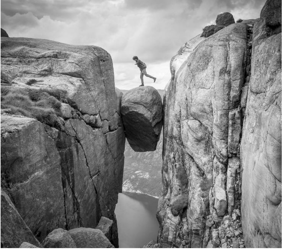
Abb. 2 Kjeragbolten, Lysefjord bei Forsand, Norwegen