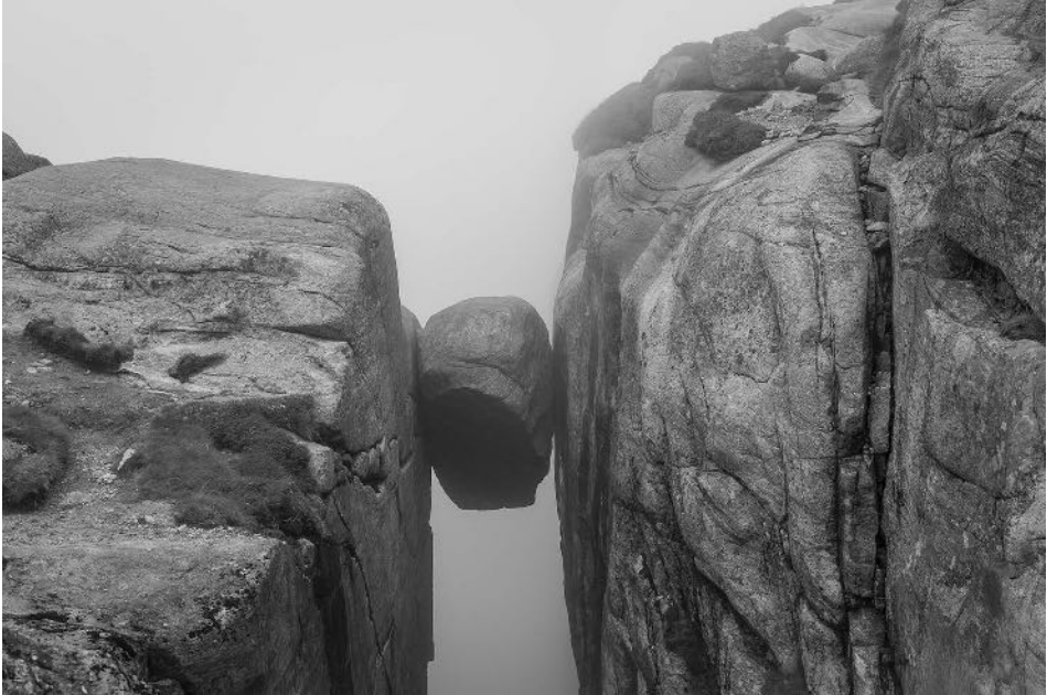
Abb. 1 Kjeragbolten, Lysefjord bei Forsand, Norwegen

Seins, die sich in den materiellen, körperlichen oder sozialen Architekturen des Raumes manifestieren. Diese stehen im Mittelpunkt unseres interdisziplinären Dialogs, dessen räumliche Ausdehnungen von zweidimensionalen Bildern über dreidimensionale Architekturen bis hin zu digitalen Welten reichen. Die Beiträge machen deutlich, dass Übergänge zwischen zwei Räumen mehr als nur eine punktuelle Grenze zwischen Hier und Dort markieren. Sie haben eine eigene Materialität, eine eigene Ausdehnung in Raum und Zeit. Zugleich stellen sie Momente der Unbestimmtheit dar. In den Arbeiten des Kulturanthropologen Victor Turner (1920–1983) wurde diese Qualität der Unbestimmtheit im Übergang unter dem Begriff der Liminalität pointiert gefasst: »Liminal entities are neither here nor there; they are betwixt and between the positions assigned and arrayed by law, custom, convention, and ceremonial«. 2 Somit erschließt sich die Frage nach der Beschaffenheit des Dazwischen stets aus dem Verständnis einer Differenz. Die Beiträge im Tagungsband nähern sich dieser Differenz und damit dem Moment der Unbestimmtheit aus verschiedenen Perspektiven der Kunstgeschichte und